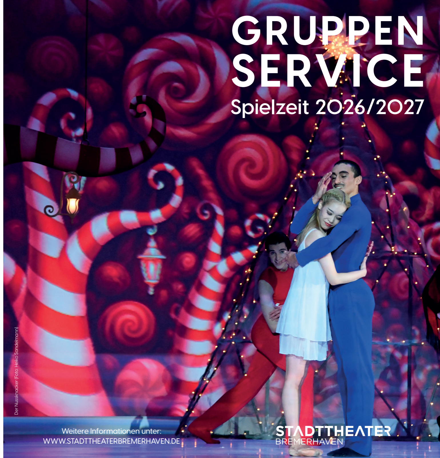
Der Nussknacker

Weitere Informationen unter: WWW.STADTTHEATERBREMERHAVEN.DE